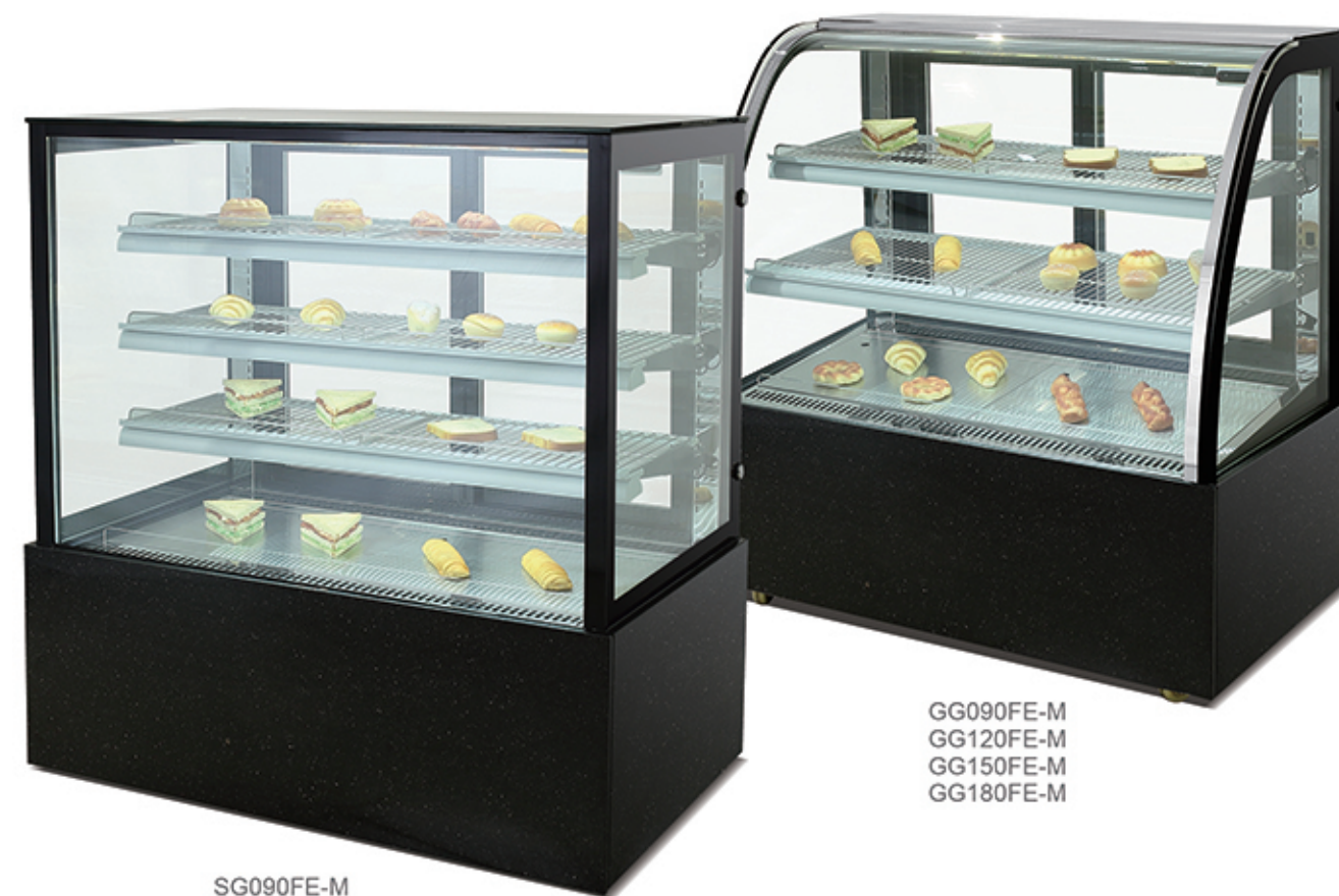
GG090FE-M GG120FE-M GG150FE-M GG180FE-M