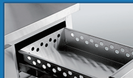
推拉式抽屉门，拿取食物方便快捷