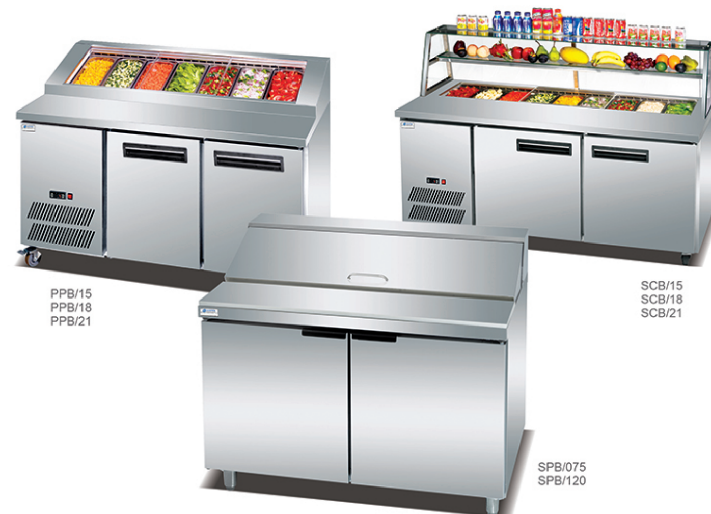
PPB/15 PPB/18 PPB/21