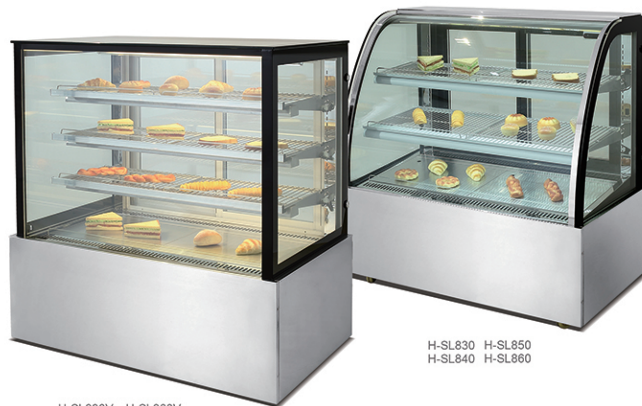
H-SL830 H-SL850 H-SL840 H-SL860