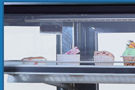
· 高精度电子温控，液晶数字清晰显示温度