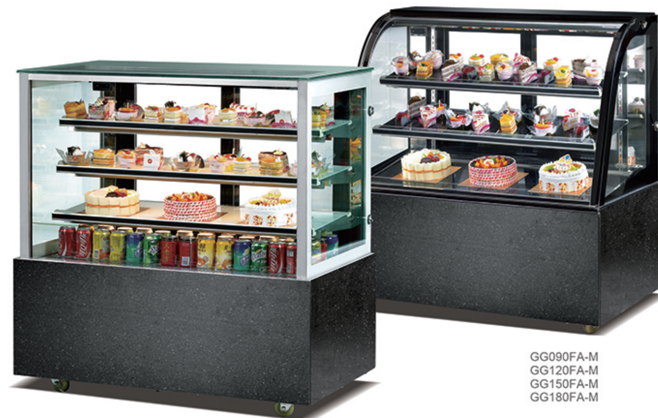
GG090FA-M GG120FA-M GG150FA-M GG180FA-M