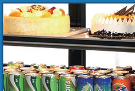
倾斜式层架可自由调节，每层设置安全防护一体节能 LED 灯