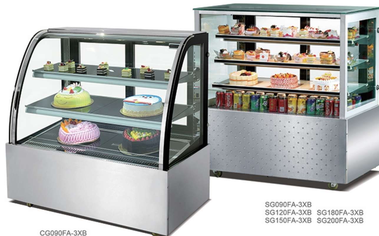
CG090FA-3XB CG120FA-3XB CG150FA-3XB CG180FA-3XB