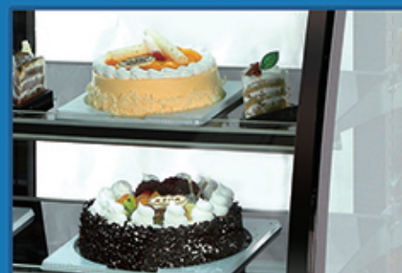
新款大弧度玻璃设计，拥有完美展示效果，晶莹透亮