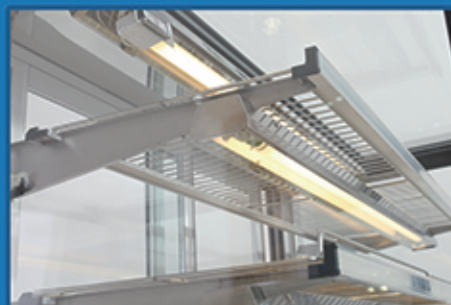
· 每层设置高效节能保温灯，保证食物的新鲜和口感就像刚出炉一样；