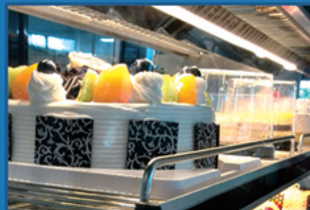
· 倾斜式层架可自由调节，每层设置安全防护一体节能日光灯