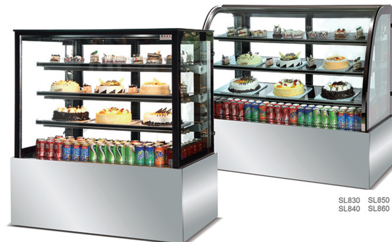
SL830 SL850 SL840 SL860