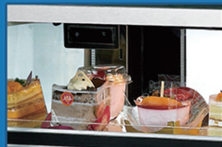
· 高精度电子温控，液晶数字清晰显示温度