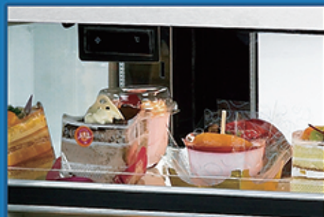
· 高精度电子温控，液晶数字清晰显示温度