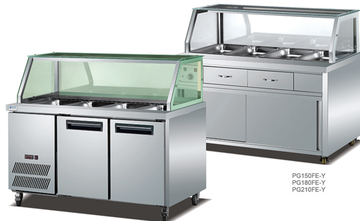
PG150FE-Y PG180FE-Y PG210FE-Y