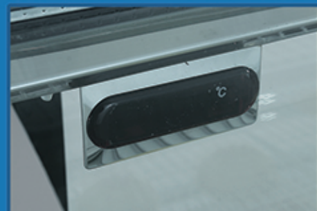
· 高精度电子温控，液晶数字清晰显示温度