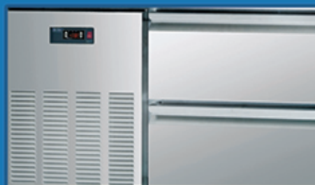
进口压缩机，高效制冷系统