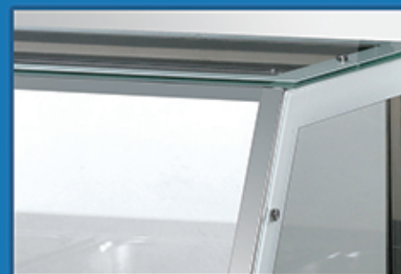
· 顶部全钢化玻璃，坚固更耐用