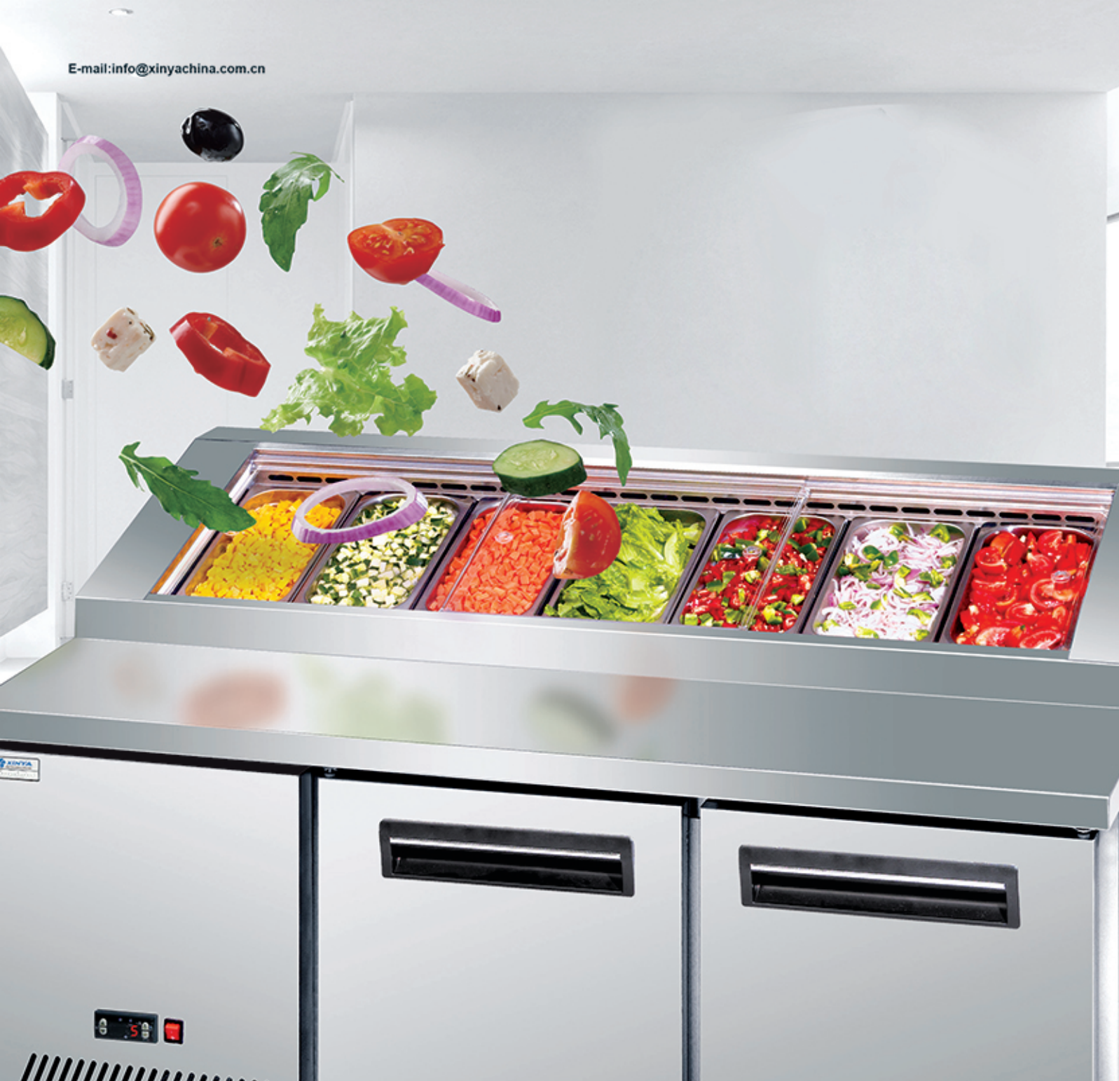
局部示意 LOCAL MAP