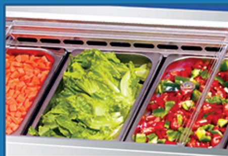
专业风道设计，份盘制冷快速均匀