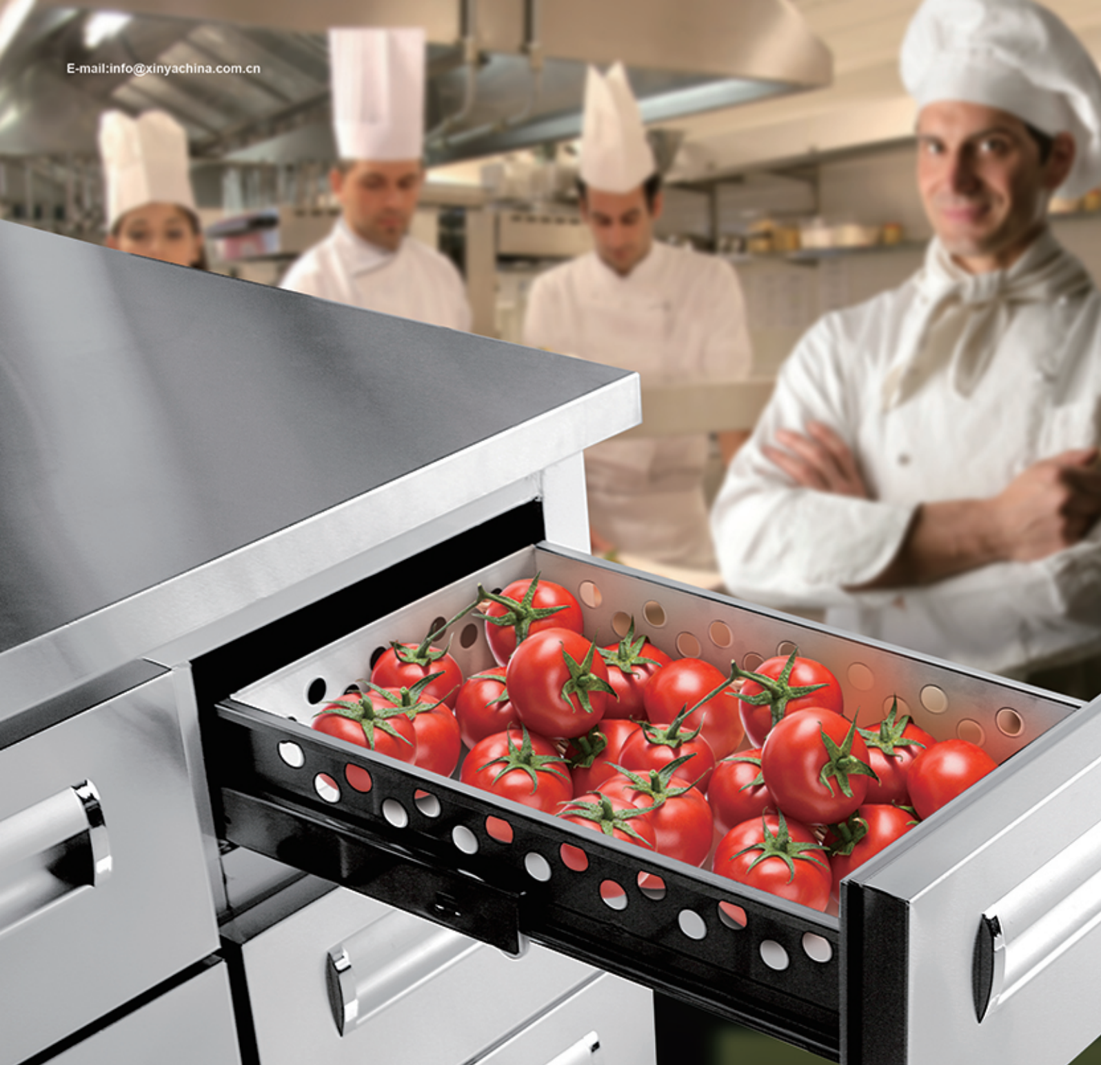
局部示意 LOCAL MAP