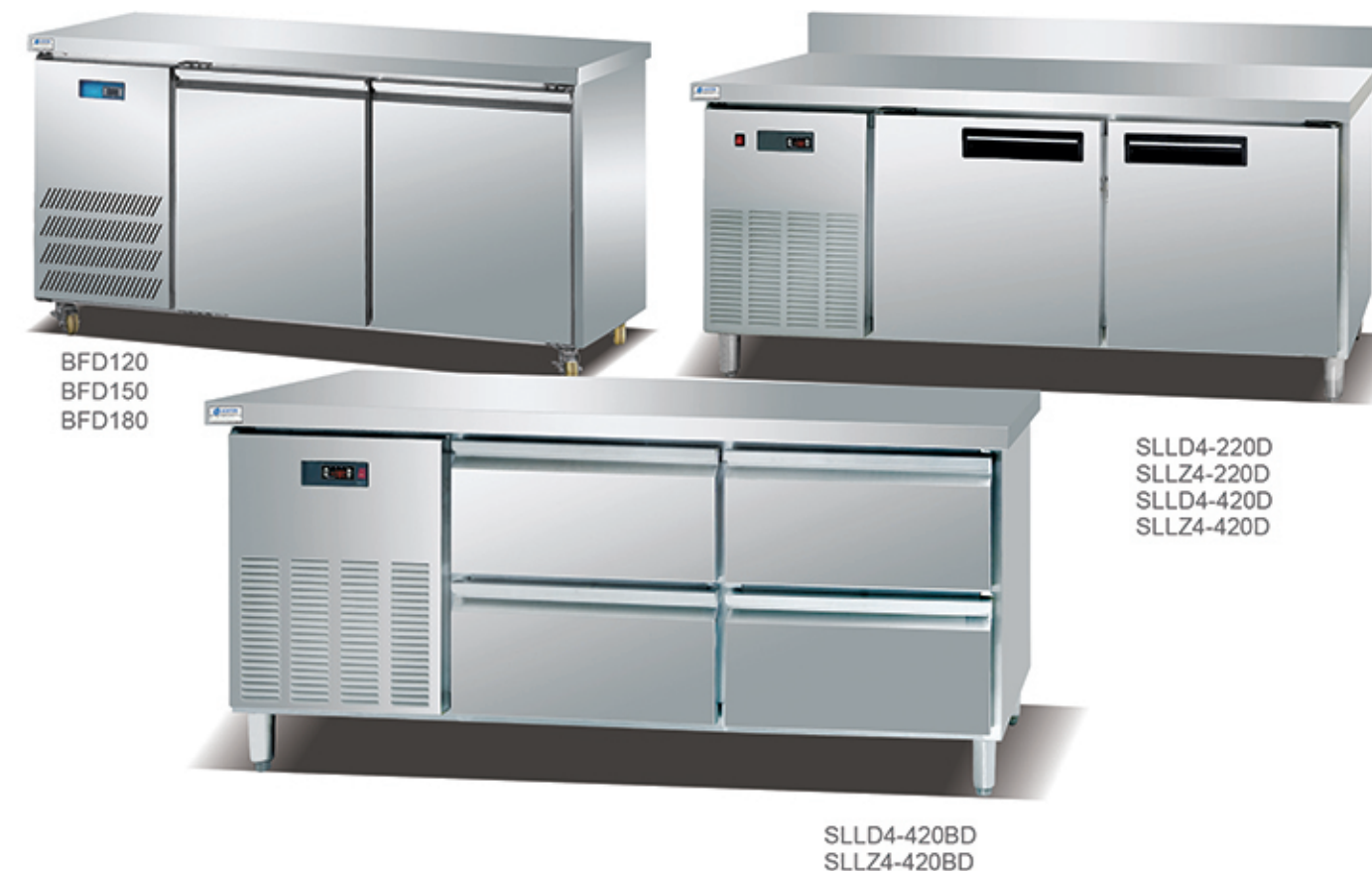
BFD120 BFD150 BFD180