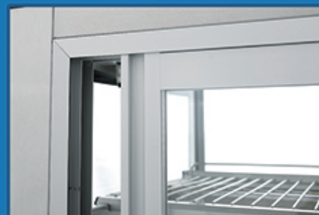
· 滑动式柜门，节约空间的同时方便取放食物，为你提供最优的空间设计；