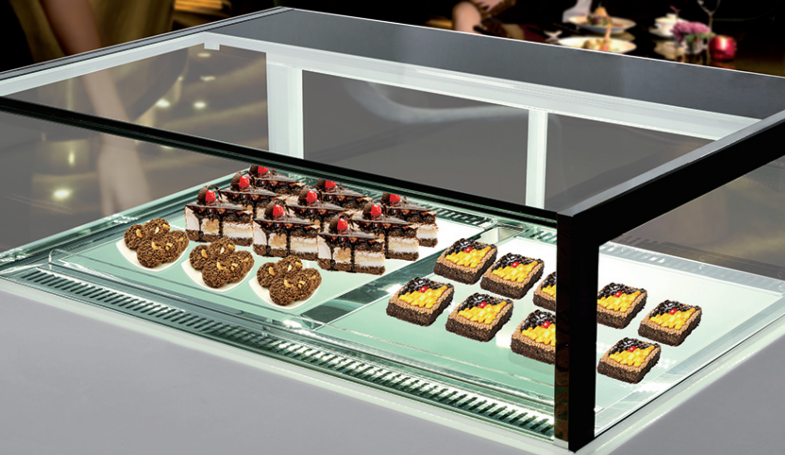
局部示意 LOCAL MAP