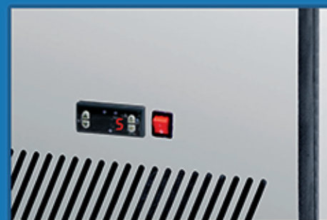
高精度电子温控，液晶数字清晰显示温度