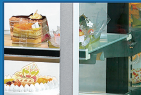
· 平面直角电热除雾中空玻璃，展示效果佳