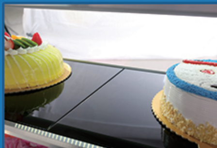
· 倾斜式层架可自由调节，每层设置安全防护一体节能日光灯