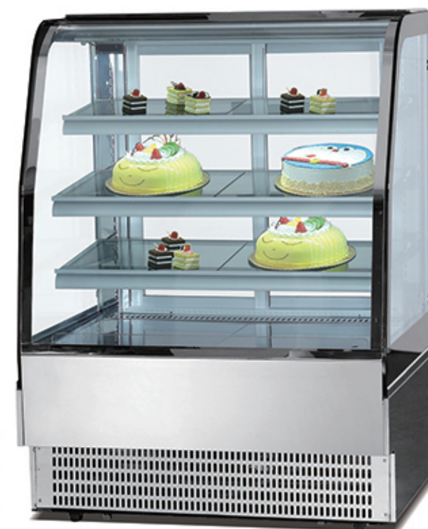
SLD830 SLD850 SLD840 SLD860