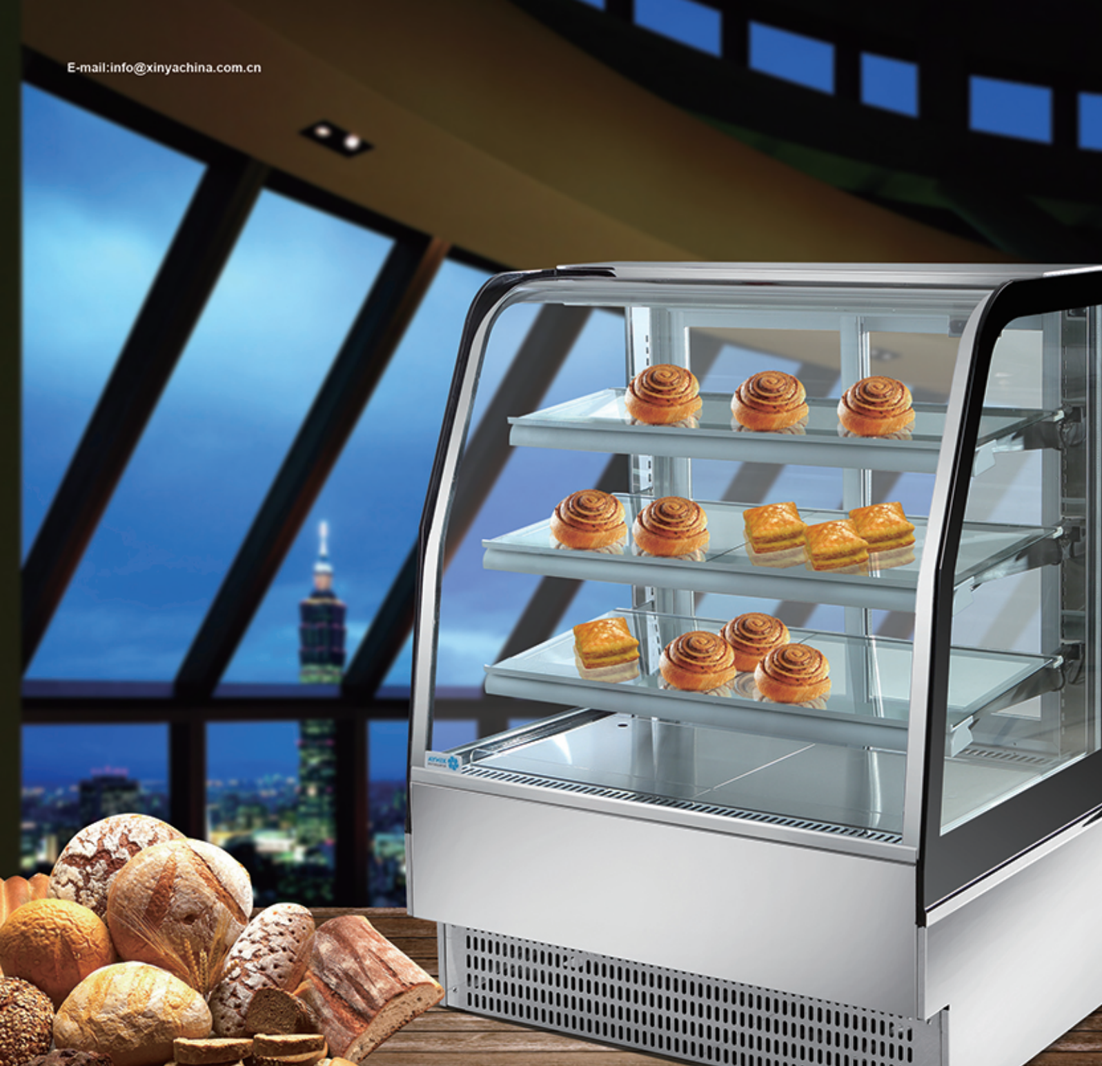
局部示意 LOCAL MAP