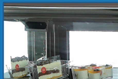
高精度电子温控，液晶数字清晰显示温度