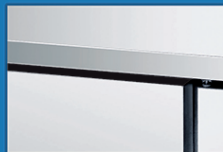
全不锈钢造型，外形美观，永不生锈