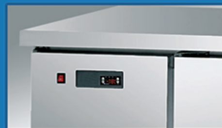
高精度电子温控，液晶数字清晰显示温度