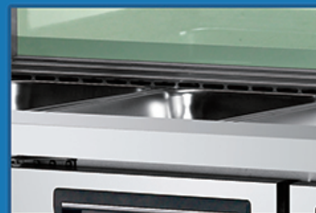
· 专业风道设计，份盘制冷快速均匀