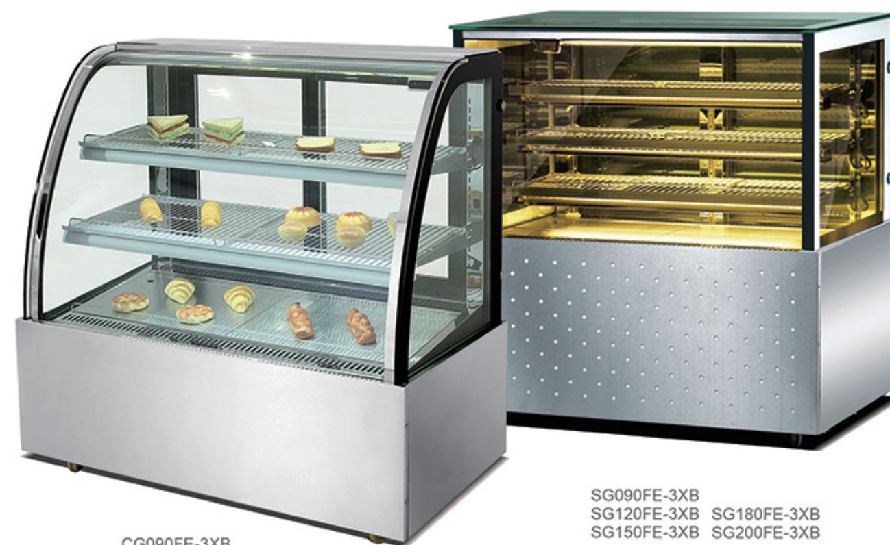
CG090FE-3XB CG120FE-3XB CG150FE-3XB CG180FE-3XB