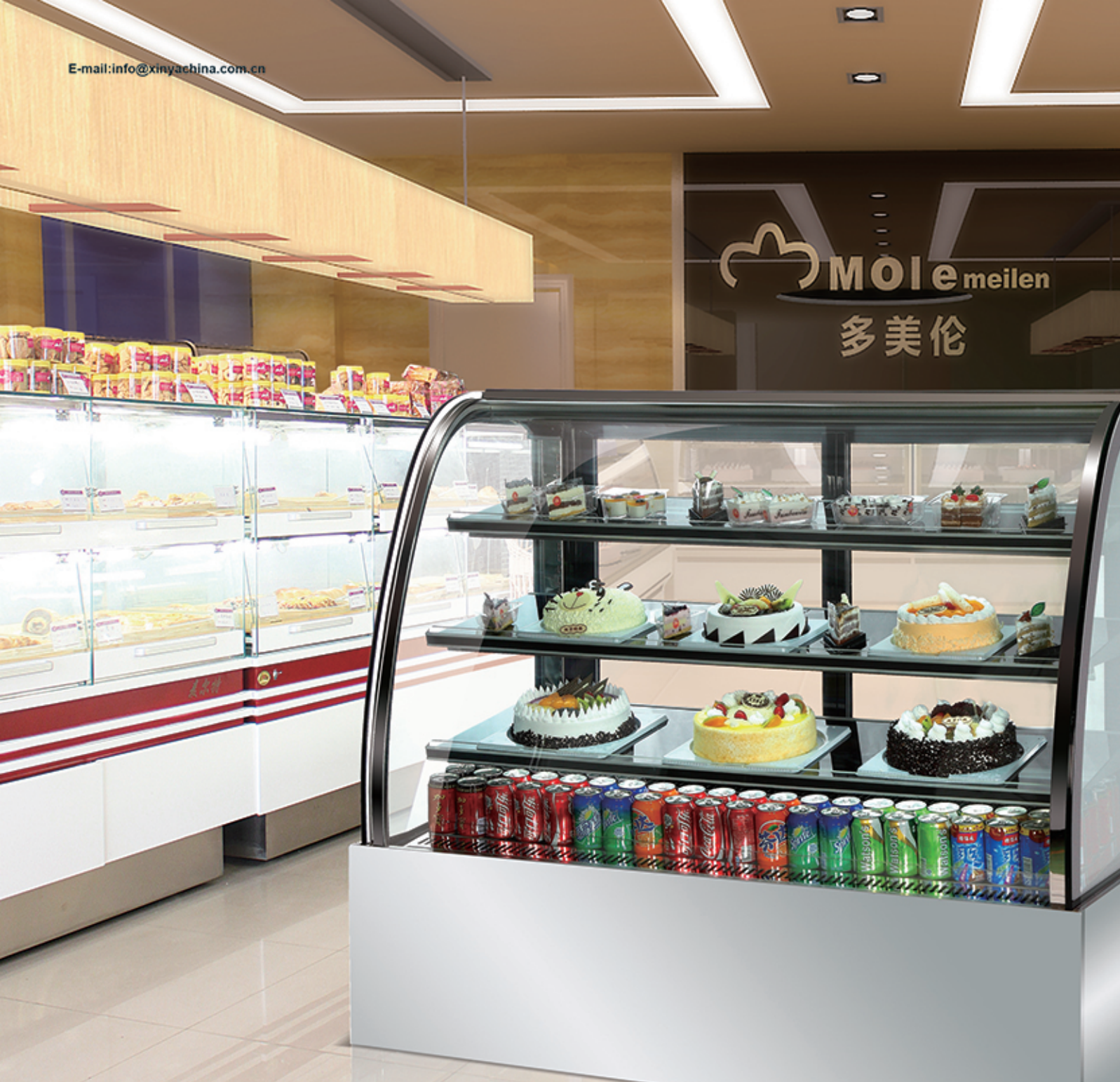
局部示意 LOCAL MAP